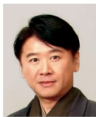
はやし かずきよ 林和清 歌人

一九六六年京都にて能楽師・味方健の長男として生まれる。幼少より父に手ほどきを受け、一九八六年、片山幽雪(入間国宝)に内弟子入門。一九九一年独立。二〇〇一年「京都市芸術新人賞」受賞。二〇〇二年KBS京都テレビにて能楽入門番組「能三昧」(全二十八回)を監修、出演する。二〇〇三年新作能「待月」の脚本を手がけシテを演じる。二〇〇四年「京都府文化賞奨励賞」受賞。二〇〇六年淡交社より「能へのいざない」を出版。二〇二二年、重要無形文化財(総合)認定。